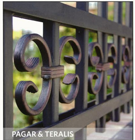
PAGAR & TERALIS